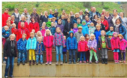
16 Familien der Pfarrgemeinde St. Johannes verlebten im Erholungspark Bestwig abwechslungsreiche Tage.

Familien verbrachten Ferien im Sauerland